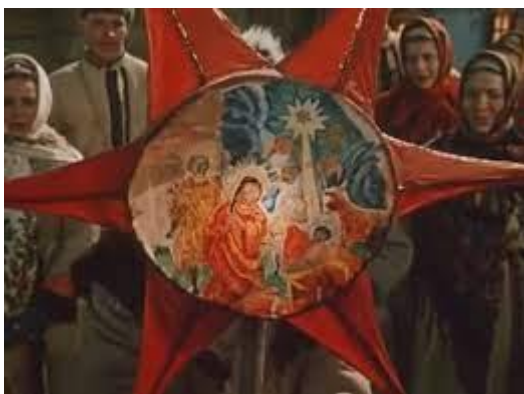
Рис.2 Колядницька зірка