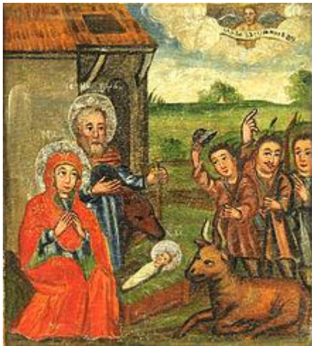
Рис. 1 Народження Ісуса Христа